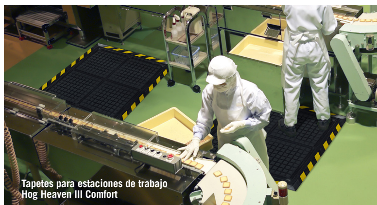
Tapetes para estaciones de trabajo Hog Heaven III Comfort