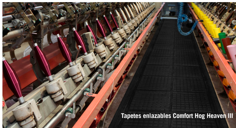
Tapetes enlazables Comfort Hog Heaven III

Nota: Los tamaños de los tapetes son aproximados ya que el caucho se encoge y se expande junto con la temperatura y el tiempo. La variación de tamaño de fabricación tolerable es 3-5%.