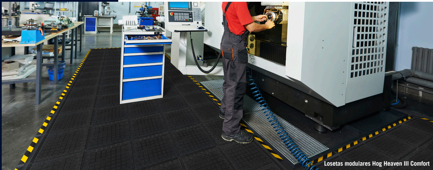
Losetas modulares Hog Heaven III Comfort